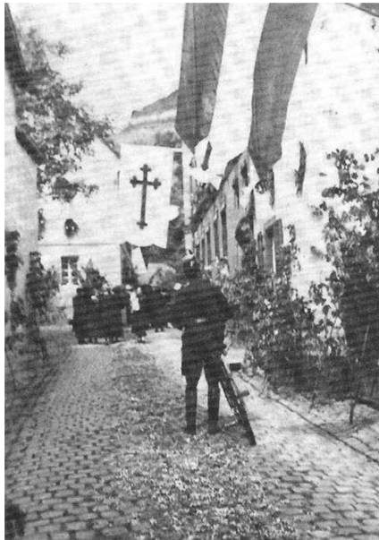
Foto 1937 Polizist mit Fahrrad hinter der Fronleichnamprozession